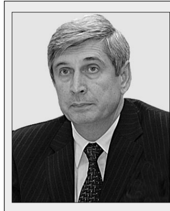
Иван МЕЛЬНИКОВ, первый заместитель Председателя ЦК КПРФ, депутат Госдумы