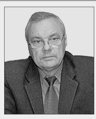
Сергей РЕШУЛЬСКИЙ, член Президиума, секретарь ЦК КПРФ, первый заместитель руководителя — координатор фракции КПРФ в Госдуме