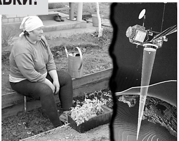
«Космические» деньги за космическое межевание (со спутниковой привязкой!). Оно вам нужно?

Как идет это оформление известно - маета и настоящий грабёж: ходи по инстанциям и собирай бумажки, и за все плати - за техпаспорт на домик, за свидетельства, за межевое дело, за справки, за скорость, за копии, за выписки, за экземпляры, за выезд, за..., за..., за.... Плати в два кармана: в государственный по квитанциям и в личный карман чиновникам. А дальше - обязательное межевание. Дошло до того, что частные фирмочки стали его делать с привязкой по навигационным спутникам. Лишь бы содрать с пенсионера за межевание 10-15 тыс. рублей! Для чего по спутникам-то? Чтобы американская ракета по дачному сортиру не промахнулась?